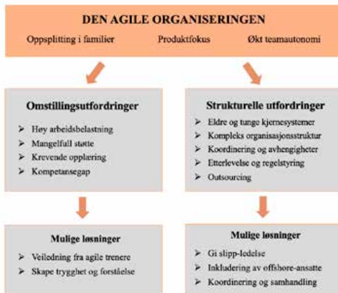
Figur 4: Modell som oppsummerer forskningsresultatene

Med bakgrunn i forskningsresultatene har vi utarbeidet en modell som sammenstiller casestudiens funn, som vist av figur 4. Konteksten for modellen er en IT-avdeling i et komplekst finanskonsern preget av store avhengigheter og reguleringer. Modellen illustrerer den agile organiseringen, og hvordan den har medført et skifte til flere familier med et produktfokus og økt teamautonomi. Videre oppsummerer modellen de ulike utfordringene ved den agile organisering, både tilknyttet omstillingsfasen og strukturelle faktorer ved selskapet. I tillegg illustreres mulige løsninger, som kan bidra til å skape en bedre grobunn for agil organisering i en slik kontekst.